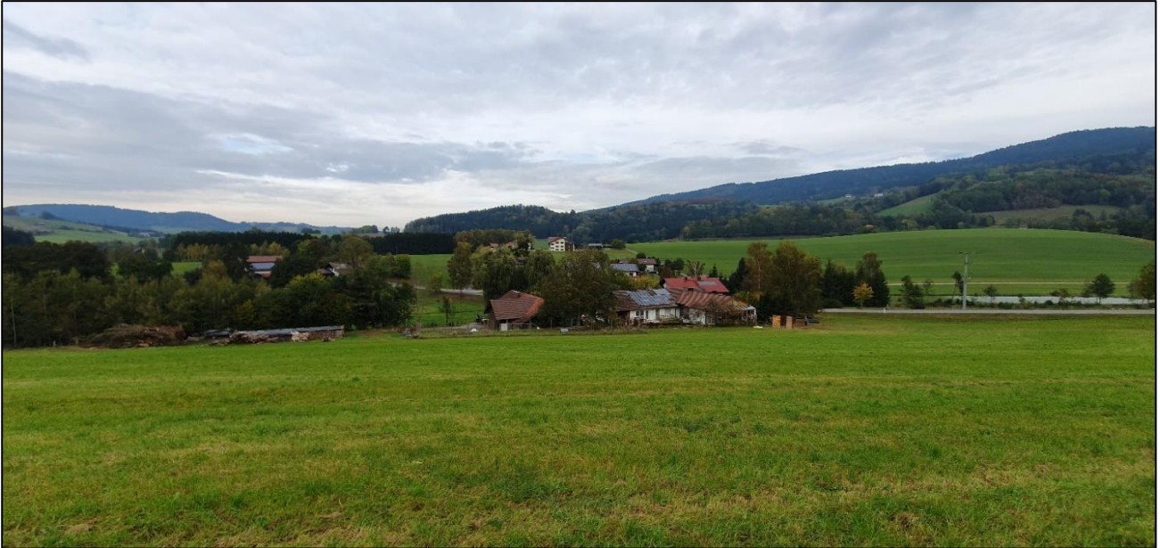
Blick vom Süden nach Norden über das Planungsgebiet. Im Vordergrund die Intensivwiese. Im Hintergrund von rechts nach links ein Teil der Gemeindeverbindungsstraße mit Einspeisepunkt (Strommast) und die bestehenden Gebäude Redlingsfurth Hausnummer 1, daneben das derzeitige Holzlager.