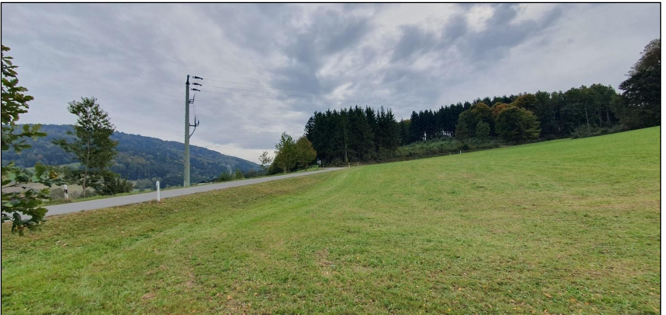
Blick von Norden nach Südosten Richtung Waldrand, Einspeisepunkt/ Strommast und Gemeindeverbindungsstraße, rechts das Plangebiet/ Intensivwiese.