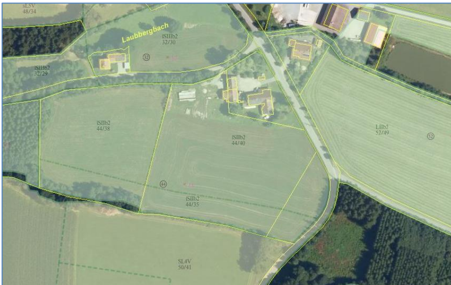
Luftbild mit Bodenschätzung

Bodentyp: In der Übersichtsbodenkarte M 1:25:000 (UmweltAtlas Bayern, LfU, 2022) wird für den Großteil des Gebiets fast ausschließlich lehmigen Sand (IS) beschrieben. Im Norden Moldanubikum s. str., Diatektischer Gneis und für einen Streifen im südlichen Gebiet Moldanubikum s. str., Diatexit. Es ist von einer mittleren natürlichen Ertragsfähigkeit auszugehen.