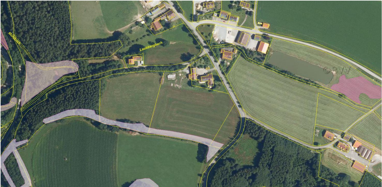
Luftbild mit Biotopkartierung