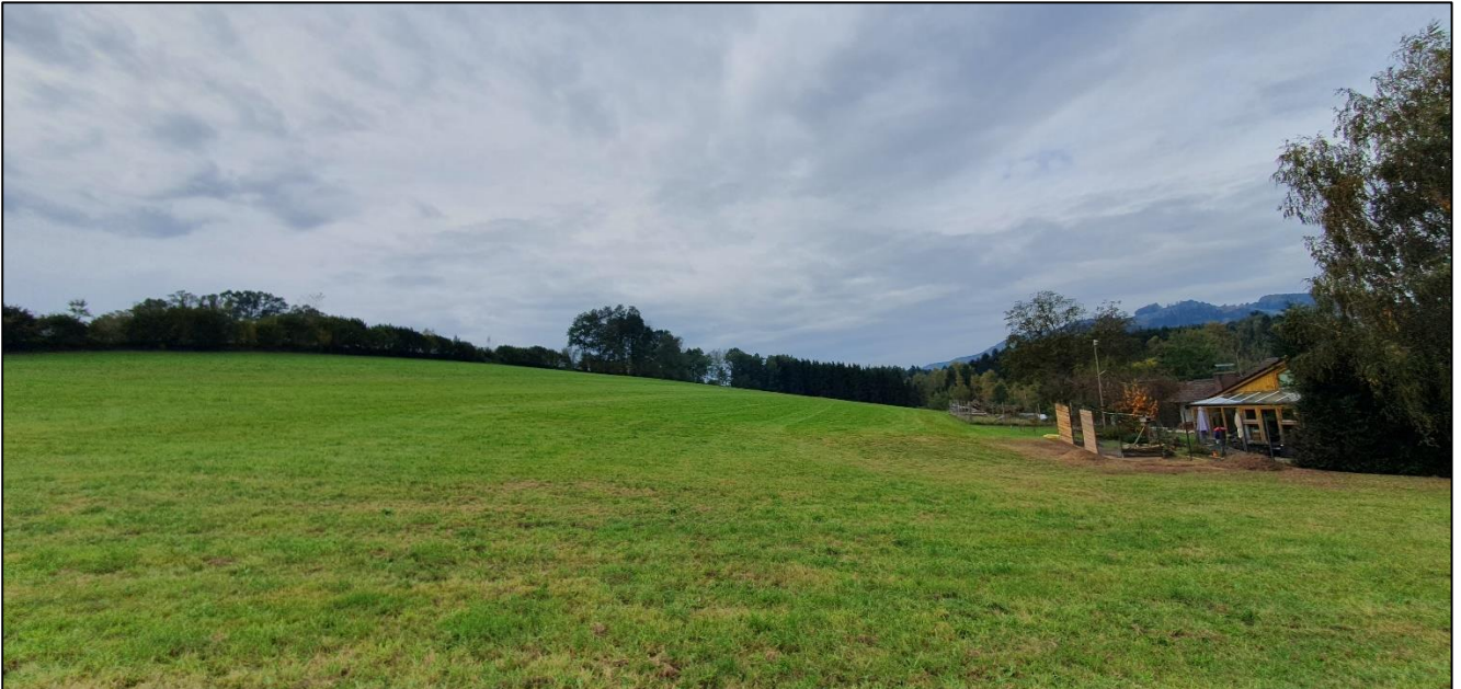
Blick Von Osten nach Westen über die Intensivwiese/ Planfläche. Rechts im Bild die Gartenflächen/ Gebäude von Redlingsfurth Hausnummer1, links der Blick auf die bestehende biotopkartierte Heckenstruktur

Naturnahe Strukturen sind innerhalb des Plangebietes nicht vorhanden. Es befinden sich keine Flächen oder Objekte im Gebiet, die in der Biotopkartierung Bayern erfasst sind. Jedoch grenzt im Süden das bestehende biotopkartierte Feldgehölz (Biotopteilflächen Nr. 6942-0354-001 „Hecken und Feldgehölze zwischen Biel und Recksberg „) direkt an den Planungsbereich.