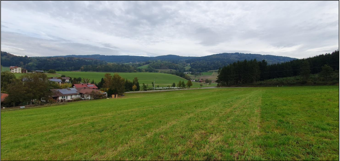
Blick von Westen nach Osten über das Bearbeitungsgebiet. Links im Bild die bestehenden Gebäude von Redlingsfurth Hausnummer 1.